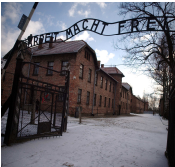
AUSCHWITZ "Il lavoro rende liberi"

PALATEATRO "G.CARRISI" - P.za Iannelli - Mirto venerdì 27 gennaio 2017, ore 10.00