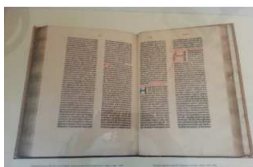
Magonza, Museo di Gutenberg La prima copia a stampa della Bibbia